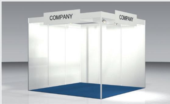
Musterskizze Basispaket · Example of basic package